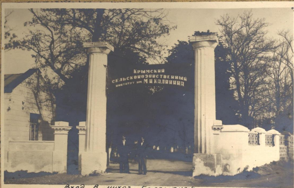
Вход в чухоз "Калгирка"