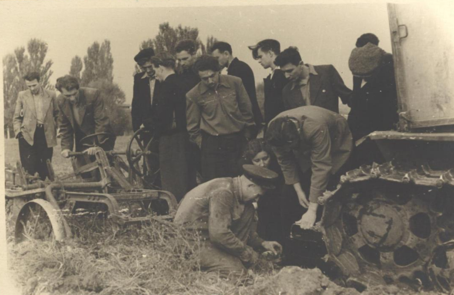
Практические занятия по стх машинам.