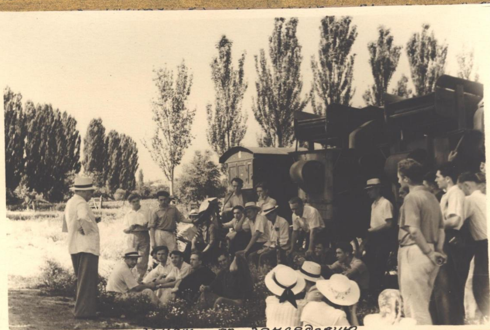
Зачет по земледелию.