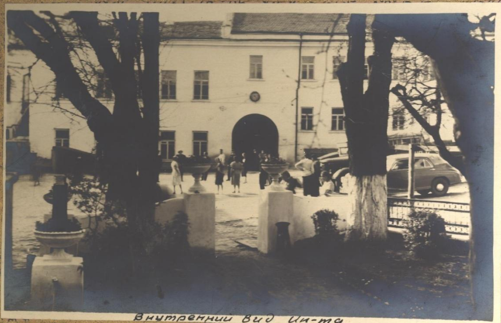
Внутренний вид Ми-ма