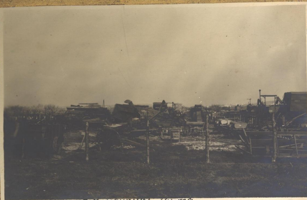
С-Х машины ИИ-мэ