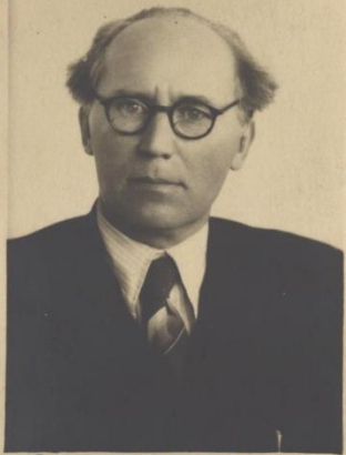
З.В. УЧ. ЧАСТИ БОЛГАРОВ П.Т.