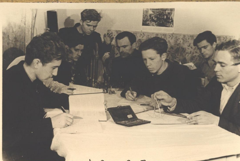
Рабочий день в общежитии.