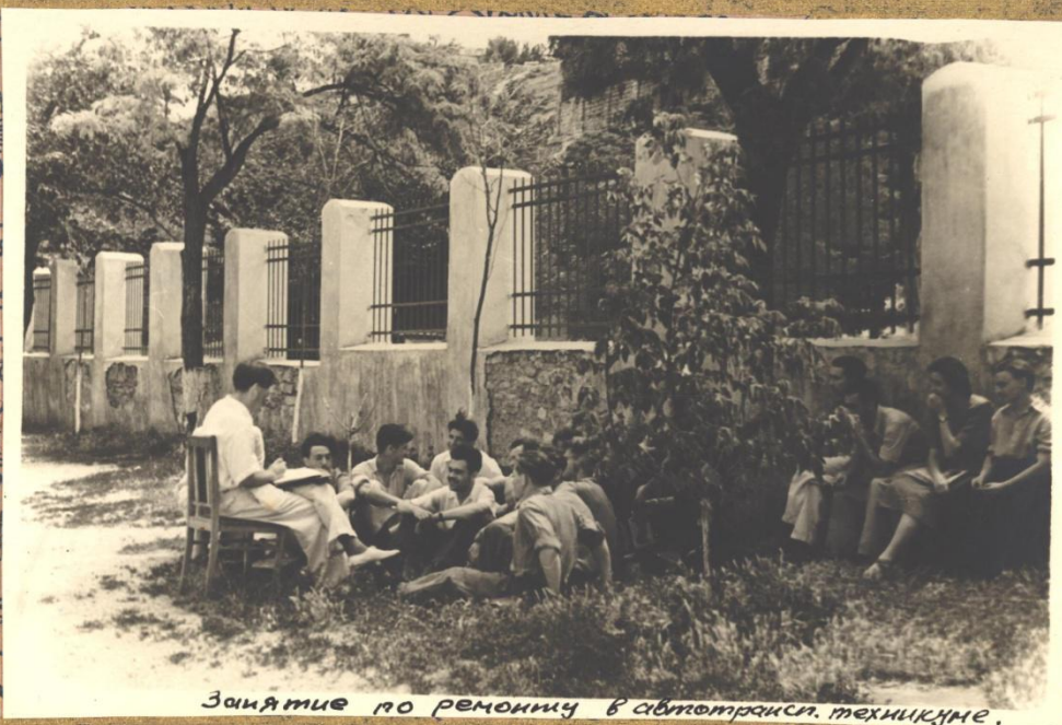
Занятие по ремонту в автотрансл. техникуме.