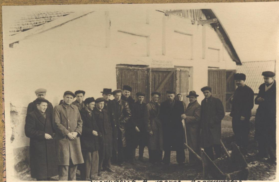
ЭКСКУРСИЯ В КОЛХОЗ „Верошилова“