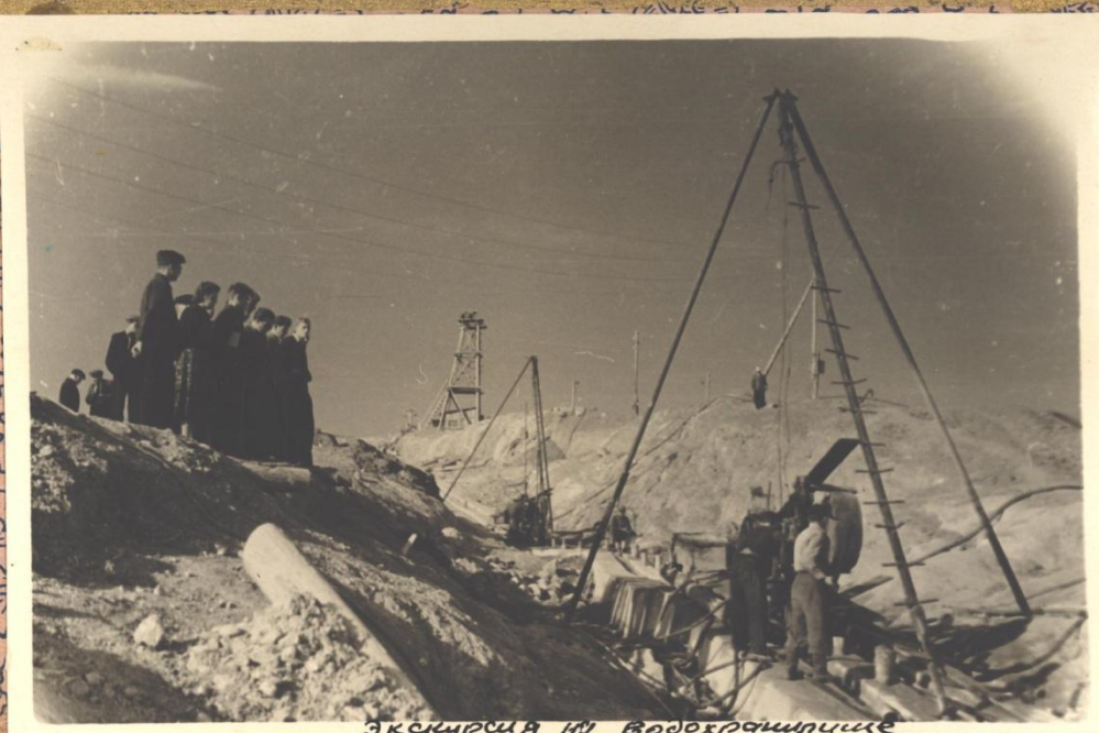
Экскурсия на водохранилище